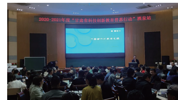
西北师范大学创新创业学院STEAM创新教育人才培养基地 讲师万晨兴 《开源硬件的教育实践》