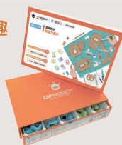
造物粒子创造力套件