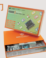
micro: bit 造物粒子编程入门套件