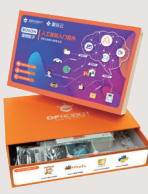
造物粒子物联网主题套件